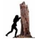
7 - 8 Aktivitetssteder