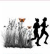
Motion i naturen