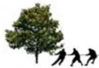
5 - 6 Aktivitetssteder