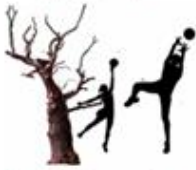
1 - 4 Aktivitetssteder