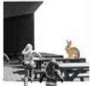
A. Naturrum / Udendørs opholdsrum og formidling