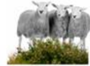
B. Afgræsset overdrev